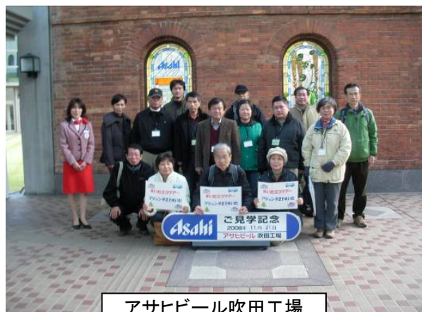
アサヒビール吹田工場