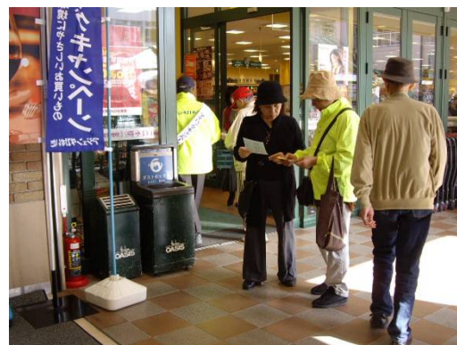
店頭キャンペーン (アンケート)