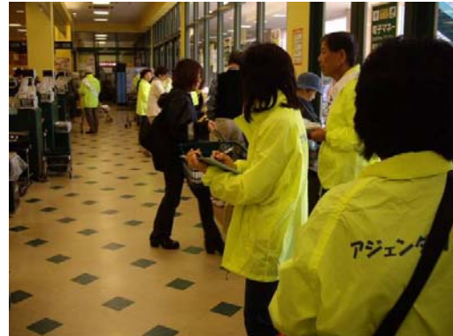
店頭キャンペーン (マイバッグ持参率調査)

また、市役所環境部の減量推進課と地球環境課の窓口、くるくるプラザの事務所等にも署名・宣言文カードと回収箱が置いてありますので、この趣旨に賛同された方は是非ご署名ください。