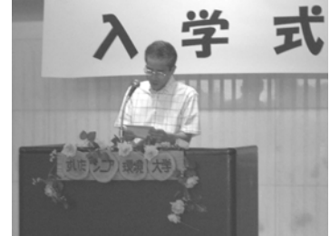
新入生代表のあいさつ

すいたシニア環境大学今年度の入学生は27名で、来年2月までに座学だけでなく、フィールドワークや学生による自主企画講座などを通じ、環境に関する幅広い知識を20回の講義の中で身に付けていただきます。その後、所定の単位を取得し、修了した人を、吹田市が小・中学校での環境教育支援や地域での環境保全活動を実践する人材である「環境(エコ)の語り部」と認定し、環境というフィールドでの活躍が期待されます。