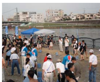
吹田まつり前夜祭 (H19.7.28)