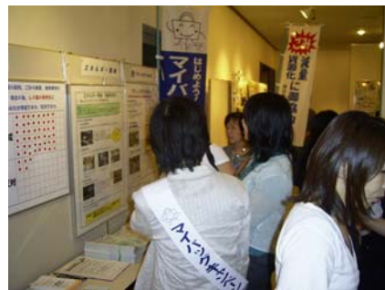
パネル展示の様子