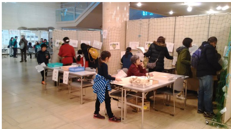
エコすごろくで遊ぶ子どもたち