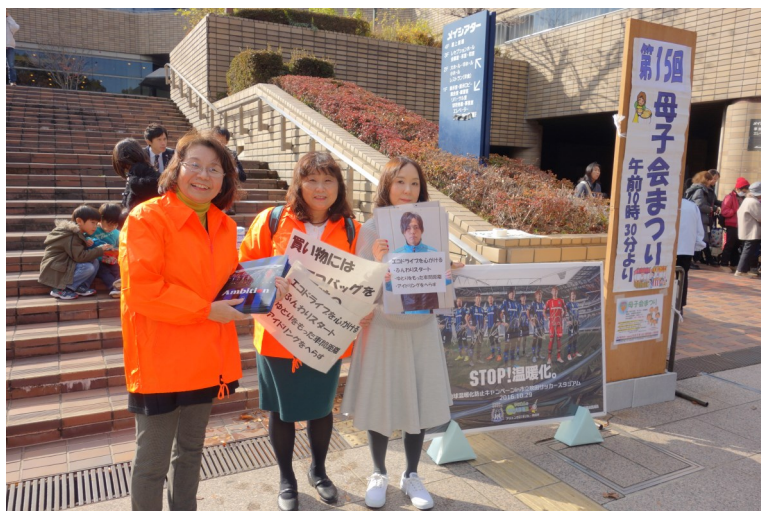
「エコ宣言」募集中の様子