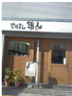
寸法直し職人 朝日町