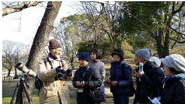
お天気に恵まれました

木の実には、「液果」（色のついた木の実）と「乾果」（液果以外の木の実）があり、「液果」は、種子分散のために色とりどりに熟した実を食べてほしいと鳥を待っているそうです。園内には、赤色や黄色、黒色などの木の実がそこかしこにあり、特に、赤色の「ガマズミ」や「クロガネモチ」、「タチバナモドキ」は目立ちます。