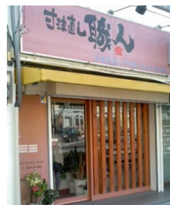
寸法直し職人 千里山