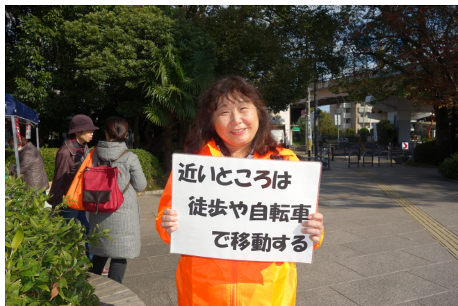
「エコ宣言」を撮影しました