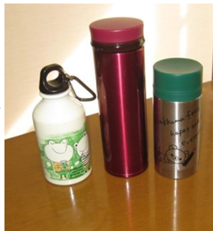
マイボトル・マイカップ