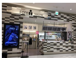
フォルムアイ ららぽーと EXPOCITY店