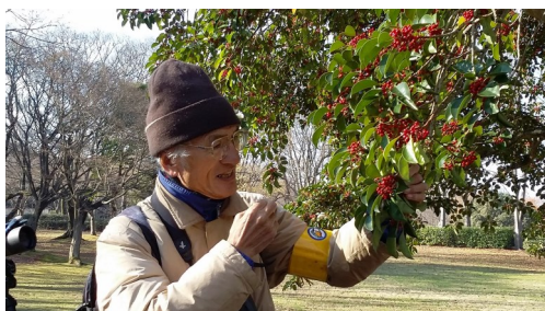
クロガネモチの赤い実 苦いので最後まで残っていると

「アトリ」は実にぶら下がって中の種を食べるのです。乾果は、風で飛んだり落ちたりして種を分散し、鳥に期待していないのであまり派手な色はしていません。でも鳥はその栄養に