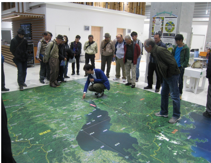
大型航空マップ「空から見た琵琶湖」にてギャラリートーク