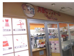
マジックマシン ガーデンモール 南千里