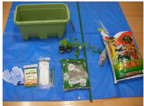
家庭菜園に必要なもの

★プランターやネットなどはそのまま使えるが、培養土は1年たつとその機能が低下する。新たな培養土の入替えがお勧め。