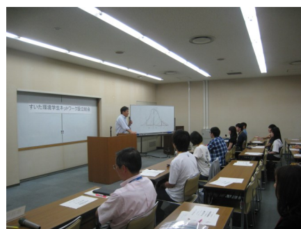
吹田市長 後藤圭二氏

①氏名 ②ふりがな ③大学（院）名 ④連絡先 （電話番号、メールアドレス）を環境政策室まで。