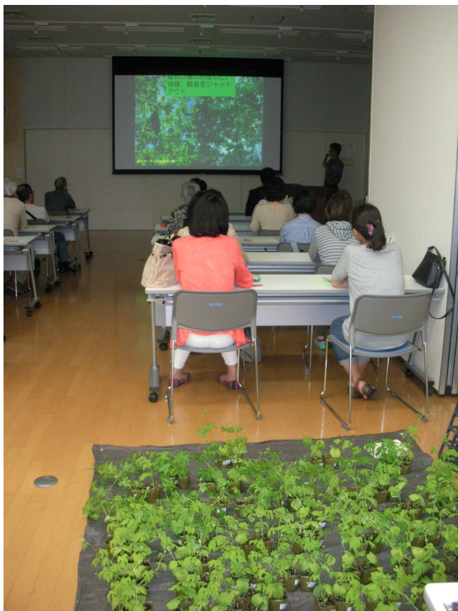
ヒートアイランドとみどりのカーテンについて説明