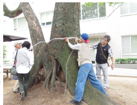
クスノキ・関西大学構内（2017/6/11）

市内全域が市街化区域に指定されている吹田は、年々田畑や空き地が少なくなり、身近な自然を感じにくい状況です。すいた市民環境会議の設立当初、自然環境の指標にもなり、人の目につきやすい大木に、身の回りの自然の代表として目を向けてもらえたらいいな、と始まったのが「吹田の大木調査」です。大きな木の幹回りと樹高を測り、幹回り200cm以上の木を登録します。今年は樹木の位置を確かなものにしようと、GPSを使って緯度経度も記録しています。吹田市内の大木の数は最初の1997年は420本、2007年は928本、3回目の今年は1500本を越すだろうと思われま。調査は予定された日に都合のつく人が参加し、自分にできる作業をします。記録係、計測係(幹回り・樹高・GPS)、写真係など、人の通るところでは交通係まで、みなさんにここを楽しみながら、参加されています。ご一緒に調査に参加しませんか？