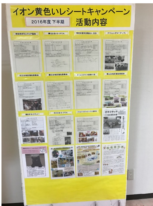
登録団体の活動内容