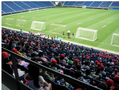
スタンドで環境クイズに挑戦する子どもたち

子どもたちに、このまま地球温暖化が進むと、地球規模や私たちの身の回りで起こることはなにか学んでもらえるように工夫。会場となったスタジアムは、ナイターの照明に「LEDライト」が採用されていることや、屋上には「太陽光パネル」が設置されており環境に配慮した施設であることも紹介し、日本一のエコスタジアムなことアピールできました。