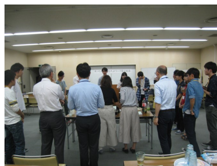
懇親会にて自己紹介