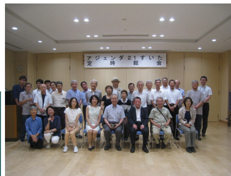
ご出席くださった皆さまの集合写真

NPO法人すいた環境学習協会（団体会員）が、平成17年から始めた「千里第二緑地」の整備保全事業が評価され、第28回全国「みどりの愛護」のつどい（金沢市）で表彰されました。おめでとうございます！