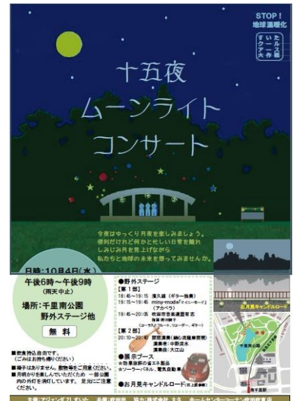
今年のムーンライトコンサート ちらし

また、9月22日(土)から30日(日)の9日間は、すいたクールアースウィークとして、すいたクールアース大作戦に連携していただけるイベントや団体を募り、すいたクールアースウィークのロゴマークの使用、イベントや団体名をホームページ等に掲載することを考えています。