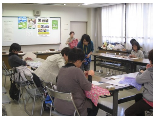
あずま袋の作成方法をレクチャーしました☆