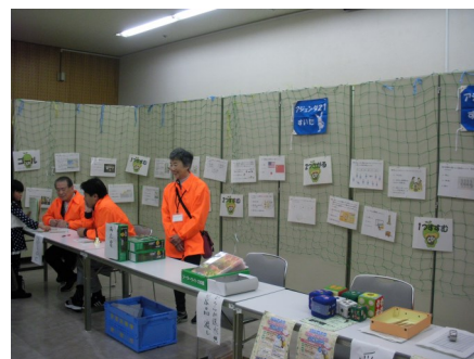
昨年同イベントにおけるエコ双六の様子 （エネルギー部会 中野 政男）