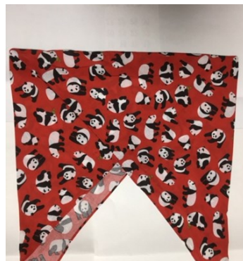
あずま袋の完成品