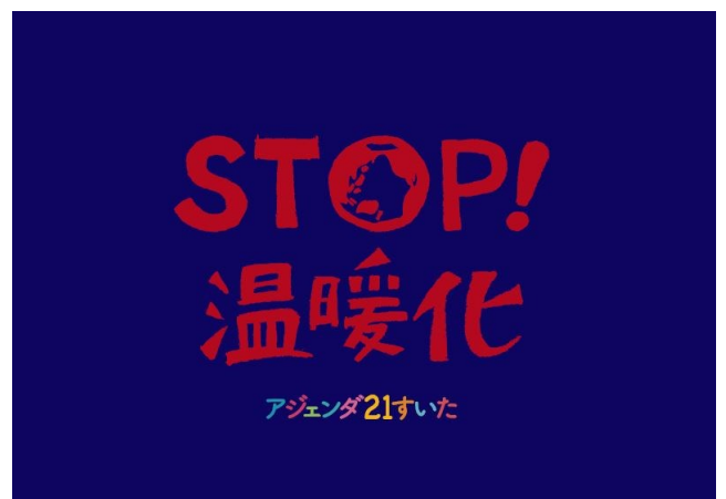
フラッグシッププロジェクトのテーマ