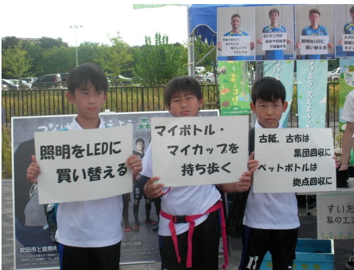
ガンバ大阪の応援にきた子どもたちもパチリ☆