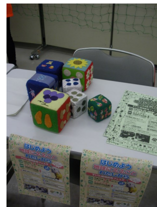
サイコロをふってゲーム

エコ双六は、パネルに「選択問題」、「ドボン！3つもどる」、「ラッキー！スキップしながら4つすすむ」など書いたシートをぶら下げ、サイコロを振って解答しながら、ゴールまで到達、その後採点してもらい、賞品をもらう環境啓発用の遊びです。「選択問題」のネタは、環境クイズとしてインターネットに沢山載っていますが、小学生向けといっても平易な問題から、環境クラブ向けの難問まで様々な状況の中、なるべく易しい問題として全18題程、取り揃えました。大人も子供と一緒に楽しく環境のことを考え、また学ぶ場になると確信しております。どうぞ、小学生から中学生の皆さん、ご両親やお友達と一緒に越し下さい。お待ちしております。