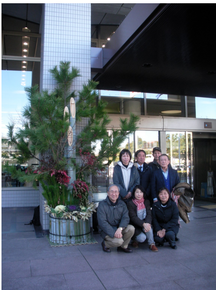
三輪代表と幹事のみなさま 吹田市役所正面玄関 門松の前にて