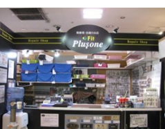
プラスワン北千里