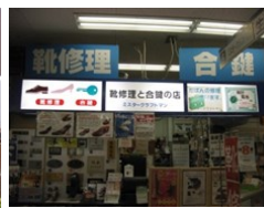
ミスタークラフトマン