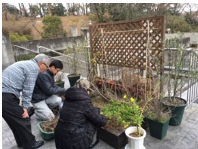
メンバーで季節の花の植え替え