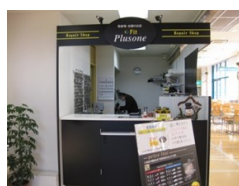
プラスワン岸辺店