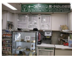
ミスタークイックマン

利用者数は、「減っている」というお店が3店舗、「変わらない」が1店舗、「いったん減ったが回復傾向にある」が3店舗ありました。はきなれた愛着のある靴を修理すると長くはけます。お店では、いろいろ相談にも応じてくれるそうです。皆さんもお近くの修理屋さんを利用してみてはいかがでしょうか？ (資源部会 水川晶子)