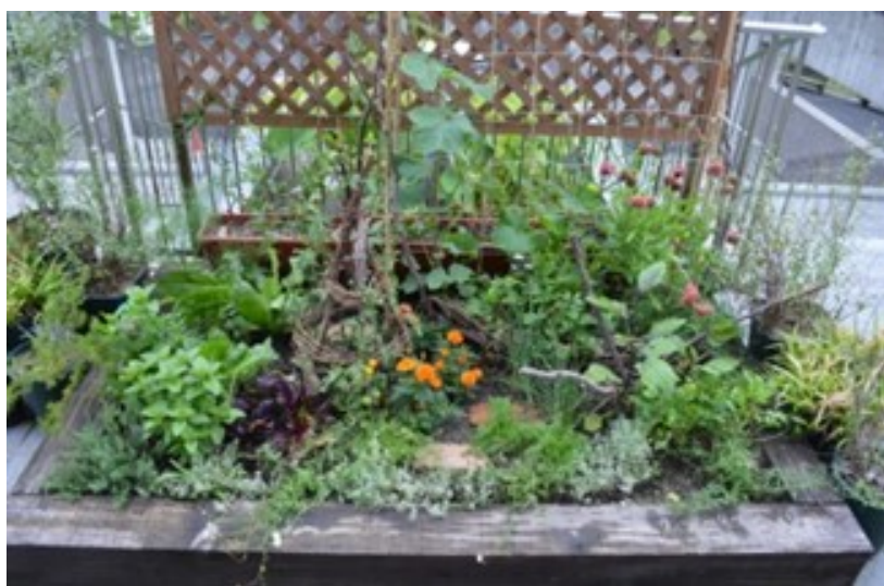
昨年のポタジェガーデン