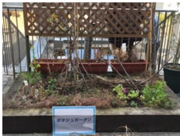
現在の冬のポタジェガーデン